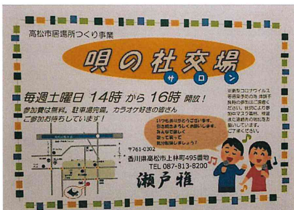
「高松市居場所づくり事業・唄の社交場（サロン）」を 毎週土曜日 14時より開催