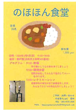
認知症カフェ 主催者による「のほほん食堂」開催